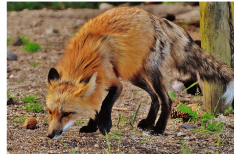
Füchse sind scheu und gegenüber Eindringlingen aggressiv

Der russische Biologe Dmitry Belyaev fragte sich, ob es möglich sei, aus wildlebenden Füchsen ( Vulpes vulpes ; s. Foto) zahme Haustiere zu züchten. Er begann mit seinem Experiment 1959 in Novosibirsk, Russland.