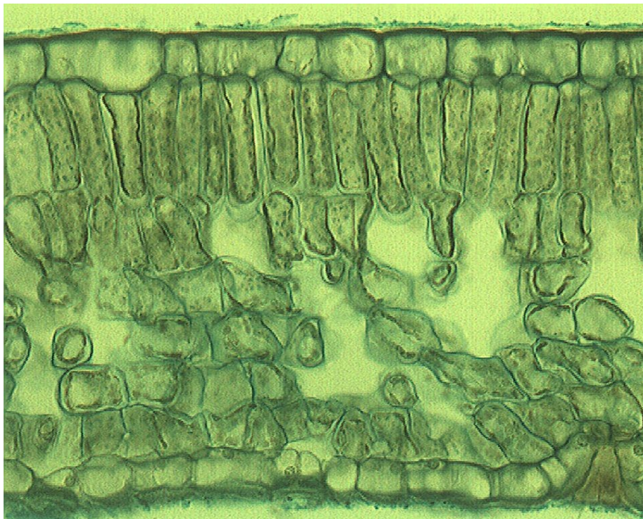
Blattquerschnitt eines Laubblattes (Mikroskopisches Foto)