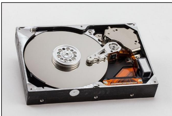
Abbildung 6: Festplatte (HDD)

Auf Festplatten oder SSDs werden Daten für längere Zeit gespeichert. Der Vorteil der SSDs im Gegensatz zur Festplatte ist, dass sie keine _____ Teile haben und somit _____ und stabiler sind.