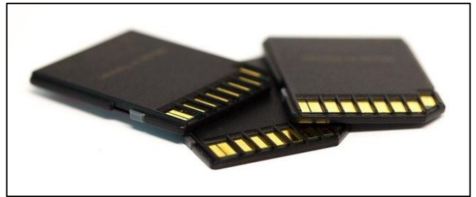
Abbildung 7: SD Speicherkarte

Über Kabel oder Funk werden meistens eine Tastatur, ein Monitor und Lautsprecher mit dem Computer verbunden. Auch Speicher können extern sein. Neben USB Speichersticks gibt es externe Festplatten und SD Speicherkarten. Auch Drucker, Scanner und _____ sind externe Geräte.